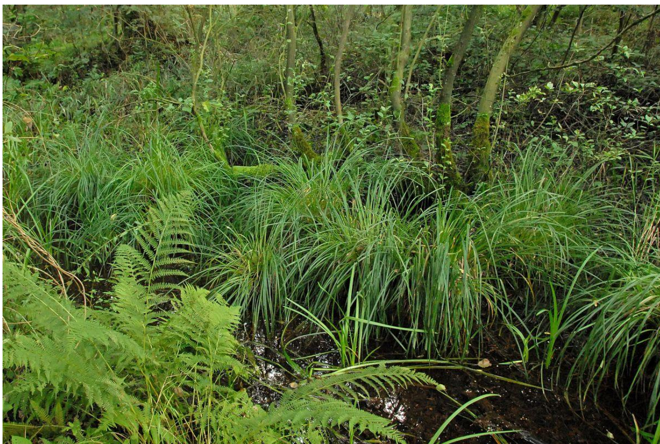
Stijve zegge in horsten