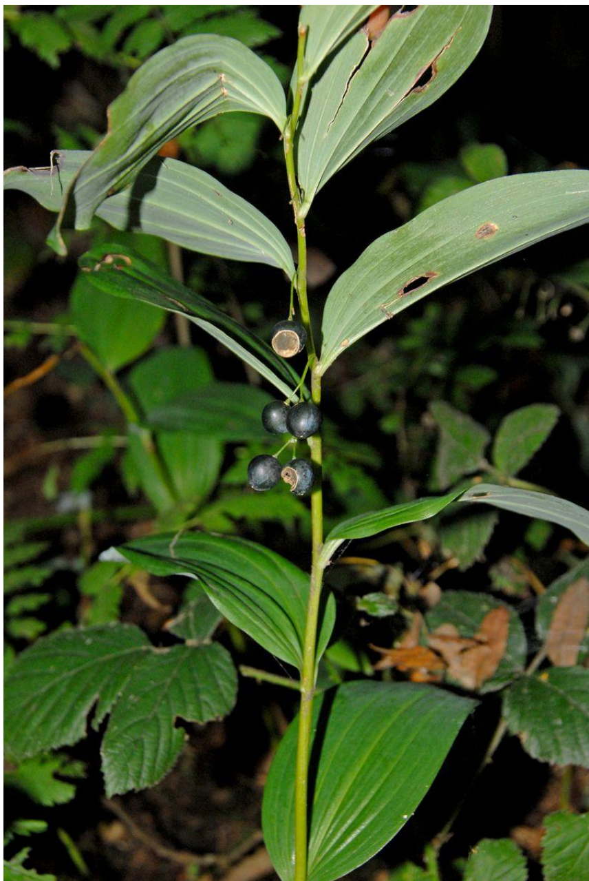
De gewone salomonszegel